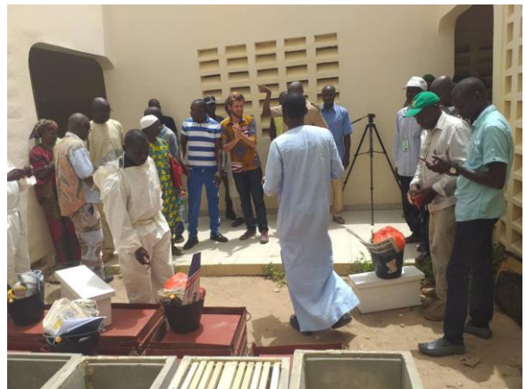
Les apiculteurs de l'association en compagnie des autorités départementales et du coordonnateur de projets de GESCOD à la cérémonie de clôture de la formation

C'est par ailleurs, en 2017 que les premiers liens se sont créés avec l'organisation française GESCOD , qui a financé la formation des 12 apiculteurs qui a eu lieu en juin 2019 à Kafountine. Ce partenariat s'est développé dans le cadre de l'appui aux trois conseils départementaux de basse Casamance, à travers lequel, GESCOD avait pour mandat de promouvoir les filières économiques prioritaires en vue d'un développement socioéconomique durable 1 .