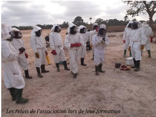
Les relais de l'association lors de leur formation

En cas de problèmes rencontrés au niveau de la conduite de leur rucher ou autres, les apiculteurs peuvent faire appel au relais de leur zone pour une assistance technique. Un relais est un apiculteur qui a des connaissances plus élevées que certains des apiculteurs membres de l'association, en technique de conduite de rucher car il a été formé par Apisen pour prendre en charge la