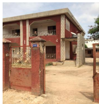
Siège social de l'association Apisen à Ziguinchor

Dans le cadre de la création de l'association, des activités de sensibilisation ont été mises en place afin d'attirer les apiculteurs de la région et solliciter leur adhésion afin que le projet de création de l'association puisse voir le jour. Ensuite, les membres de l'association ont obtenu un siège social qui leur a été octroyé par l'Inspection Régionale de l'Élevage, qui n'est autre que leur premier partenaire national. Les futurs membres de l'association ont pu bénéficier de l'appui de leur partenaire qui les a aidés à travailler sur l'organisation de Apisen et la mise en place du bureau exécutif. Suite à cela, le bureau exécutif est allé chercher la reconnaissance juridique qu'il a obtenue en 2015.