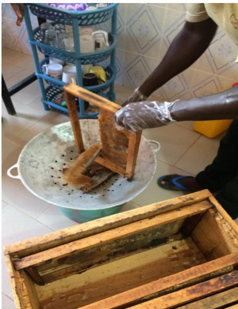
Extraction artisanale du miel par l'un des apiculteurs de l'association