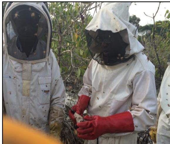
Les deux formateurs agréés (Le secrétaire et le technicien apicole) en train de donner une formation