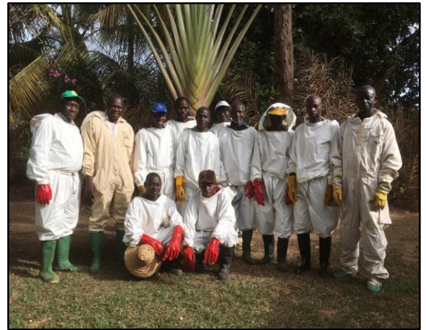
Les relais de l'association en compagnie du président, du secrétaire et du technicien apicole

De 2015 à 2016, il y a eu une stabilité au niveau des membres du personnel. C'est seulement à partir de 2017 que des changements ont eu lieu au sein des membres du conseil d'administration. En 2017 un seul membre a été remplacé et en 2018 un tiers des membres sont partis puis ont été remplacés par de nouvelles personnes dont quelques femmes. Et cela, afin d'augmenter leur représentation au sein du conseil d'administration.