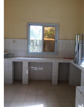
L'UTC de Kafountine

L'accès à ces UTC leur permet d'avoir à leur disposition l'uniforme adéquat (Blouse de laboratoire, coiffe, bottes etc.) et l'ensemble du matériel de traitement et de conditionnement (Extracteur, maturateur, herse etc.) dont ils ont besoin pour extraire leur miel, le passer dans le maturateur et enfin procéder à sa mise en pot. Et cela, dans le respect des normes internationales d'hygiène et de qualité. Ils peuvent en outre, faire usage d'un gaufrier dans le cas où ils souhaitent fabriquer des feuilles de cire gaufrées.