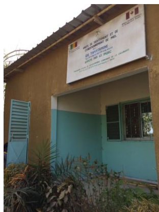
L'UTC de Kafountine

Le fait d'être membre de l'association Apisen donne un accès à deux unités de traitement et de conditionnement (UTC) qui pour la première, se situe à Kamobeul dans le département de Ziguinchor et la seconde, à Kafountine dans le département de Bignona. Les apiculteurs qui le souhaitent peuvent se rendre à l'UTC qui se trouve la plus proche de leur lieu de résidence. Pour cela, ils doivent en échange fournir 5 % de leur production de miel afin de compenser les frais associés à l'usage de l'unité. Et il n'est pas nécessaire d'avoir une production de miel abondante pour avoir accès à ces deux UTC.